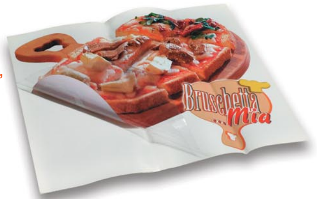
Art.-Nr. 7778 Fensteraufkleber 35 x 30 cm