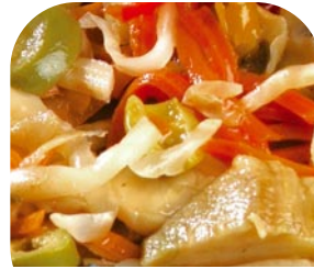
T51 Leckeres Mischgemüse