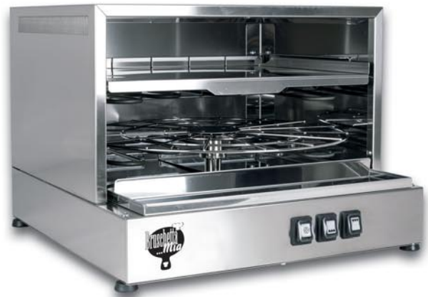
Art.-Nr. 7440 Multifunktionsofen klein für Bruschetta, Piadina und Pizza

2 Etagen (unten 1 Drehrost, oben 1 feste Kochplatte), elektrische Widerstände mit 3100 W (Widerstand unten 1700 W, Widerstand oben 1400 W), 230 V. Erhältlich auch zu 380 V (Art.-Nr. 7470V) 730 x 450 mm h Gewicht 23 kg, mit Edelstahlschieber für Piadina/Pizza, Art.-Nr. 7590