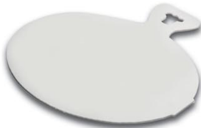
Art.-Nr. 7670 Mitnahmeschachtel