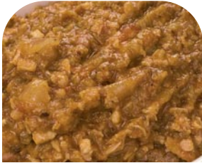
VXH Tinga (mexikanische Salsa)