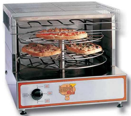
Art.-Nr. 7420 Drehofen

2 Roste zu Ø 40 mm 3 elektrische Widerstände à 1100 W V 230/1/50 Hz 490 x 520 x 390 mm h Gewicht 18 kg Erhältlich auch mit 380 V (Art.-Nr. 7420V)