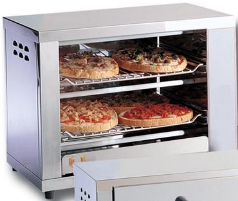
Art.-Nr. 7480 Backofen, groß, ortsfest 2 interne Bleche, 2 Verschlüsse mit Hitzeschutzfunktionsgriff, IR-Strahlung 440 x 250 x 390 mm h, 1800 W V 230/1/50 Hz, Gewicht 12,5 kg