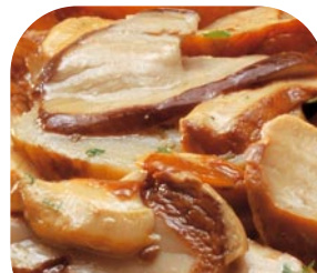
GQ1 Steinpilze in Scheiben, gedünstet