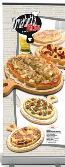
Art.-Nr. 090N Bruschetta...Mia- Roll-up 80 x 200 cm