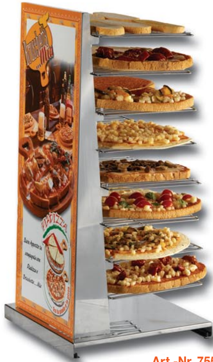
Art.-Nr. 7555 Brotregal aus Stahl, 8 Fachböden (Fassungsvermögen 16 Bruschettas) 30 x 30 x 71 h cm