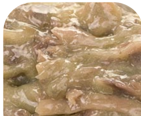
MC7 L'Acciugosa - Sardellensauce

Eine Auswahl unserer bruschetta-produkte