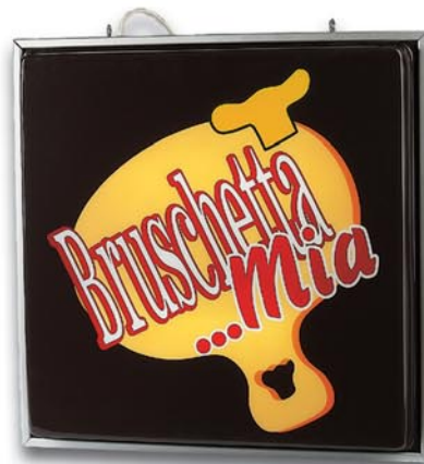
Art.-Nr. 7320 Leuchtschild für Innenbereiche, einseitig 70 x 70 cm