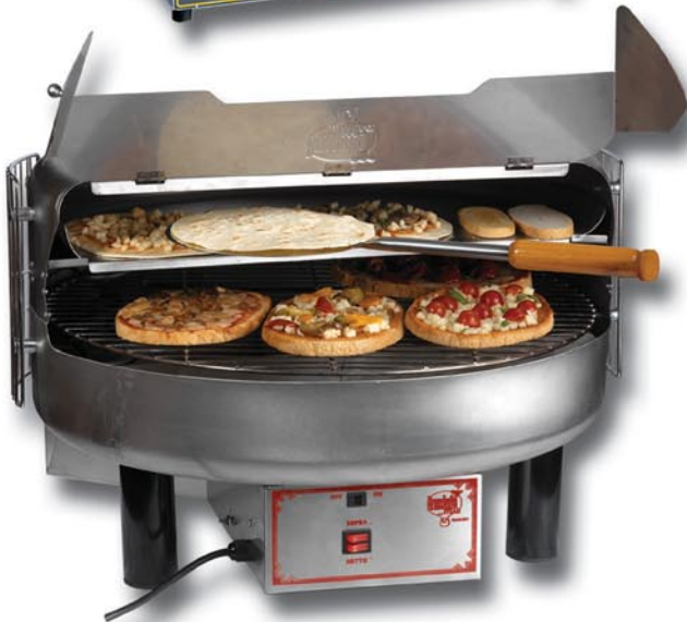
Art.-Nr. 7470 Multifunktionsrundofen

1 internes Blech, Verschluss mit Hitzeschutzfunktionsgriff, IR-Strahlung 440 x 250 x 280 mm h, 1200 W V 230/1/50 Hz, Gewicht 10 kg