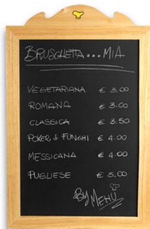
Art.-Nr. 7340 Tafel mit Holzrahmen 50 x 76 cm