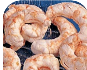
MS9 Krabben, gefriergetrocknet