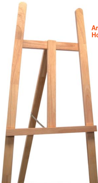
Art.-Nr. 064 Holzstaffelei