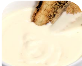
EF1 Käsecreme, streichfähig