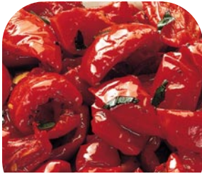
TX1 Halb getrocknete Tomaten