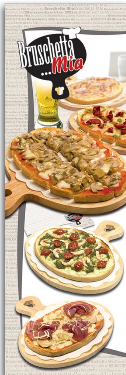
Art.-Nr. 090 Bruschetta...Mia-Säule 137 x 42 cm