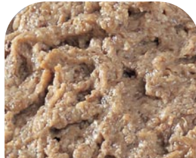
EXH Champignoncreme mit Trüffelaroma