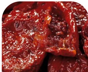
UA1 Getrocknete Tomaten „Tutto Sole“