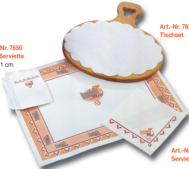
Art.-Nr. 7620 Tischset