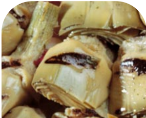
TO1 Gegrillte Artischocken