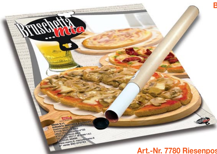
Art.-Nr. 7780 Riesenposter Bruschetta...Mia 70 x 100 cm