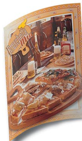
Art.-Nr. 7770 Schild Bruschetta...Mia- Ecke 28 x 40 cm