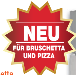
Art.-Nr. 7407 Backofen für Pizza und Bruschetta

Rostkapazität: 3 große Bruschettas, Stromaufnahme: 1300 W + 1100 W – Gesamtaufnahme 9,7 A, Stromversorgung: 230 V, 50 Hz, Gewicht: 16 kg Abmessungen: 47 (Tiefe) x 45 (Breite) x 32 (Höhe) cm Rostdurchmesser: 400 mm, Rostumdrehungen: 2 komplette Umdrehungen pro Minute, Bedienung Widerstände und Einschaltung: Schalter mit 3 unabhängigen Tasten. Zubehör: ausziehbare Piadinaablage, ausziehbarer Krümelschubladen Entfernbare Hitzeschutz.