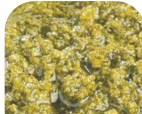
C3H Pesto alla Genovese