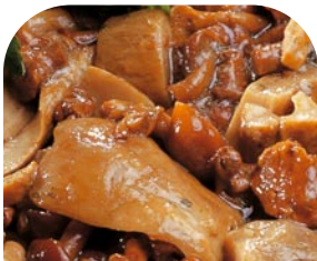
G71 Pilzmischung „Poker“