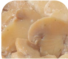
FE1 Wiesenchampignons, gedünstet (steril zubereitet)