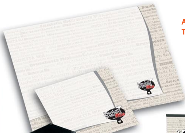
Art.-Nr. 7620N Tischset