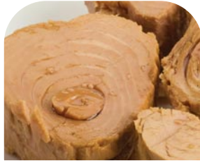
MI003 Thunfisch in Olivenöl