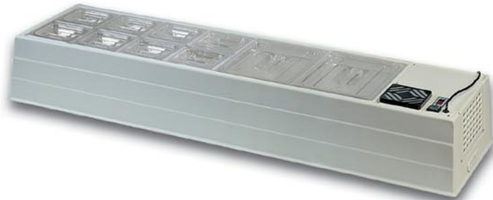
Art.-Nr. 0346 Kühlleinheit mit Wannen (aus Polycarbonat), Inhalt 17 l, Modell Micro, 102 x 41 x h 22 cm Mit Schalen und Abdeckungen aus PVC.