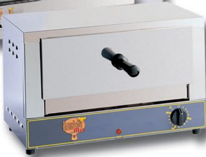
Art.-Nr. 7430 Backofen, klein, ortsfest

2 Roste zu Ø 40 mm 3 elektrische Widerstände à 1100 W V 230/1/50 Hz 490 x 520 x 390 mm h Gewicht 18 kg Erhältlich auch mit 380 V (Art.-Nr. 7420V)