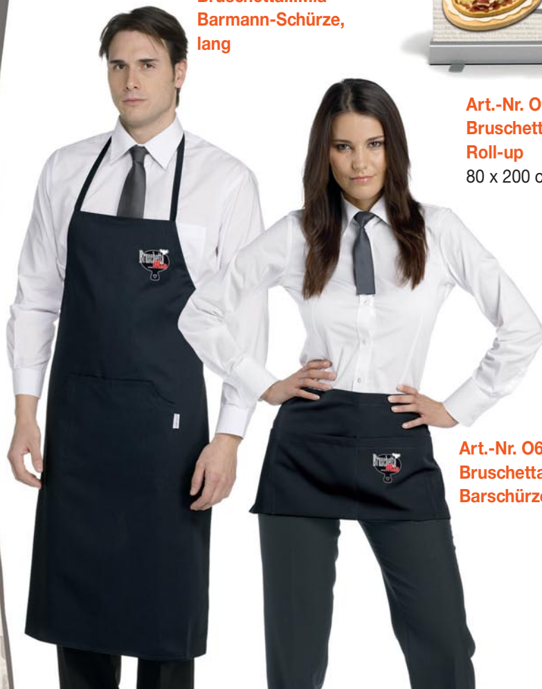
Art.-Nr. 0691N Bruschetta...Mia- Barmann-Schürze, lang