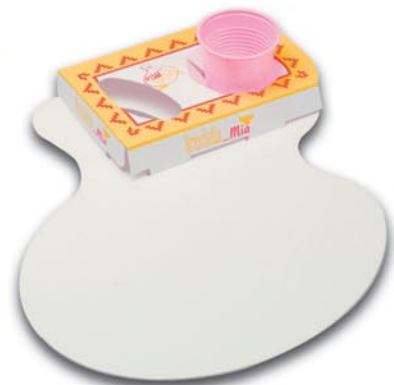
Art.-Nr. 7675 Transportschachtel für Bruschetta mit Becherhalter