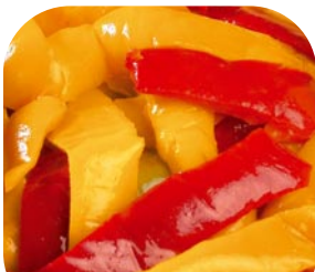
V41 Peperonepronto - Paprika