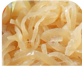
VL1 Zwiebeln in Scheiben