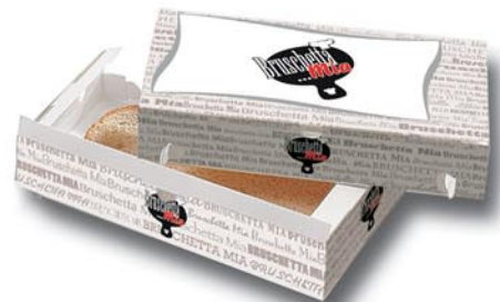
Art.-Nr. 7660 Transportschachtel